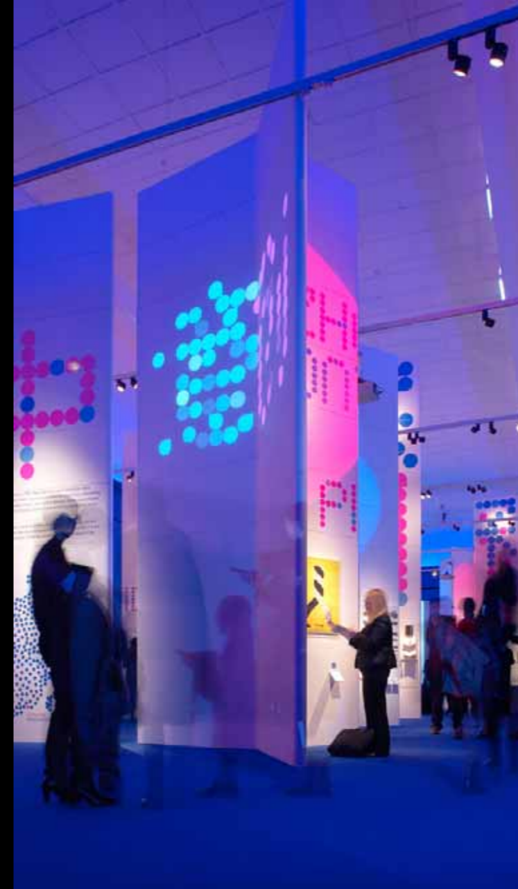
01.03 > 01.04 >